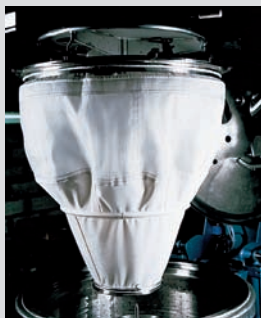
Sefar bag centrifuge Sefar- Filterzentrifugensack