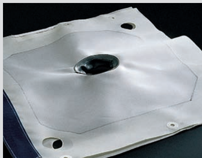
Standard neck and welded PP eyelets Standard Filtertuchhals, PP Ösen

Die globale Präsenz erlaubt es uns, kundengerechte und auf lokale Anforderungen abgestimmte Lösungen für verschiedenste Sieb- und Filtrationsanwendungen und alle gängigen industriellen Filtertypen anzubieten. Unsere Leistungen umfassen neben gebrauchsfertigen Filtern auch Zubehör, sowie Zertifikate und Dokumentationen. Filterkomponenten wie Rondellen, Plissees, Schläuche und Bändchen werden im Reinraum produziert. Strenge Prozesskontrollen garantieren die Erfüllung anspruchsvoller Normen, z. B. aus der Medizin und der Automobilindustrie.